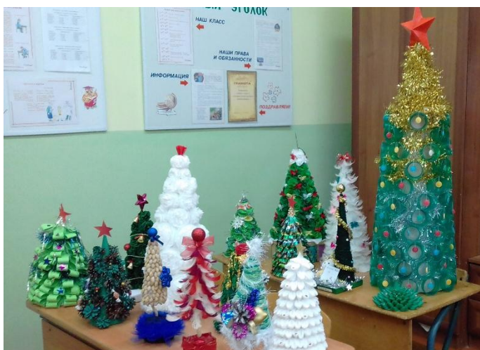
Всероссийский конкурс «Ёлочка, живи!»