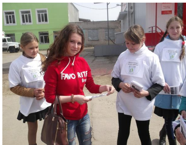
Социальные акции «Мусору – нет!»