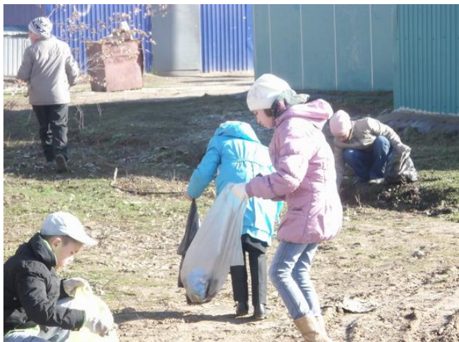
Трудовой десант по уборке территории