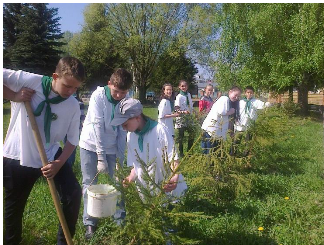
Акции по посадке деревьев