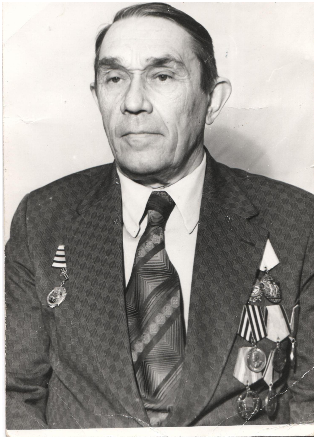
Фото 1984 год.