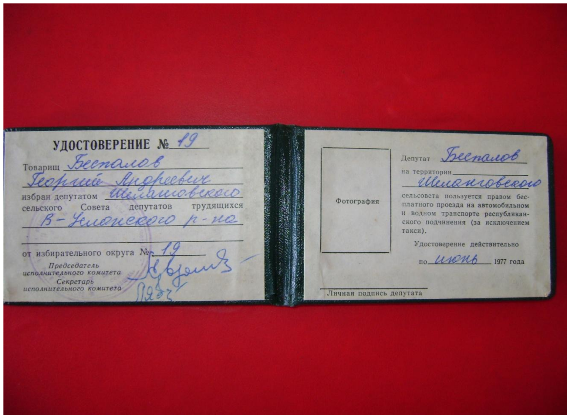
Фото 1978 год