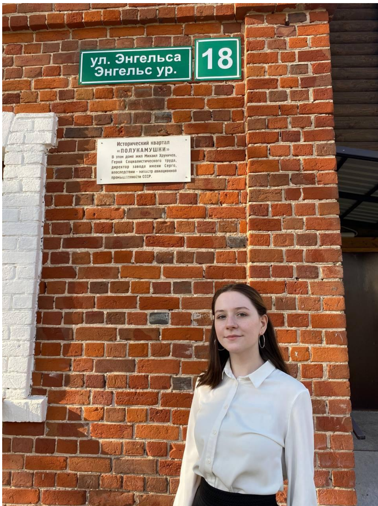
Мемориальная доска Герою Социалистического труда М. Хруничеву