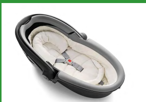
Автокресло «люлька» группы 0 для детей массой менее 10 кг

Детские удерживающие устройства подразделяют на 5 весовых групп: