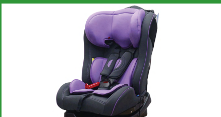
Автокресло группы II для детей массой 15-25 кг