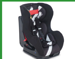
Автокресло группы I для детей массой 9-18 кг