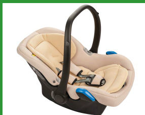
Автокресло группы 0+ для детей массой менее 13 кг