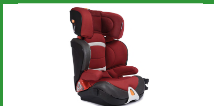
Автокресло группы III для детей массой 22-36 кг (возможно использование бустера)