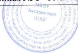
График оценочных процедур МБОУ «Аксаринская ООШ» на 2024-2025 учебный год II полугодие