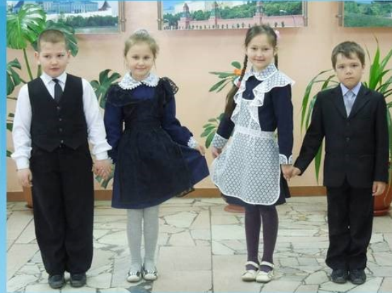
Школьная форма 1-4 классы