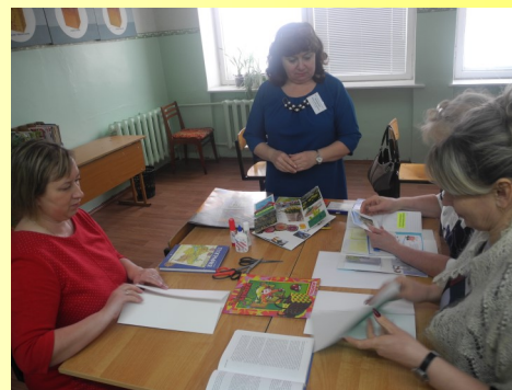
Английский язык. Насилие. Как с ним бороться?