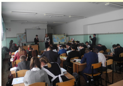
Английский язык. В мире животных. Решение практических задач