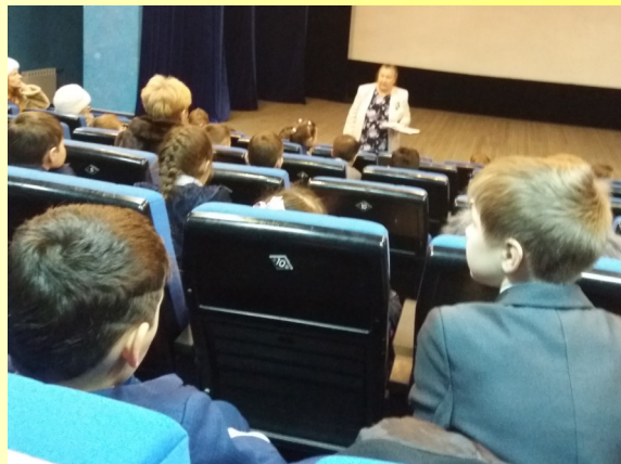
Урок литературного чтения "Зимний день в стихотворениях А.С.Пушкина"