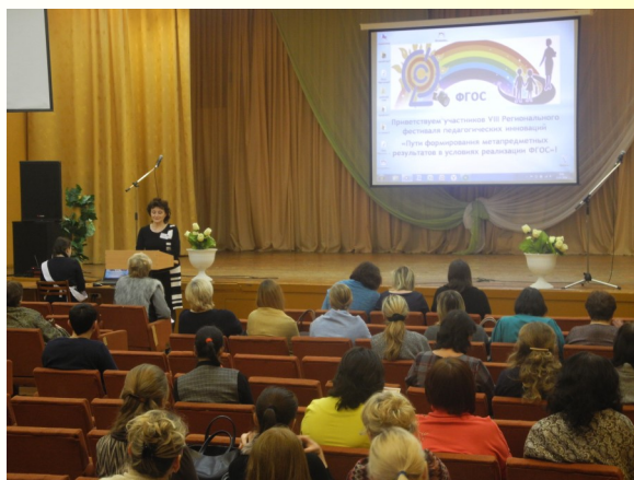
География и музыка. Ритмы и краски Южной Америки

23 января в нашей школе прошел Региональный фестиваль педагогических инноваций по теме: «Пути формирования метапредметных результатов в условиях реализации ФГОС». Метапредметный подход позволяет формировать целостное мировоззрение, взаимосвязь нескольких предметов. Поскольку именно человек является основным субъектом своего образования, то и смысл образования состоит в выявлении и реализации внутреннего потенциала человека по отношению к себе и внешнему миру. Связь внутреннего и внешнего в человеке обеспечивается через деятельность. В этих основаниях и заключена метапредметная суть образования. Семинар прошел очень ярко и насыщенно. Учителя показали открытые уроки с применением современных педтехнологий, провели интересные мастер-классы, продемонстрировали результаты своей плодотворной работы.