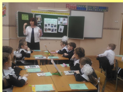
Разряды имен прилагательных по значению. Качественные прилагательные