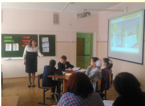
Родной (татарский) язык. Тамчы-шоу

Родная (татарская) литература. Ф.Яруллин. «Зәңгәр күлдә Ай коена»