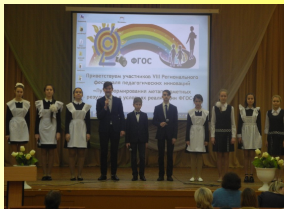
География. Технологии формирования познавательных метапредметных результатов в обучении географии