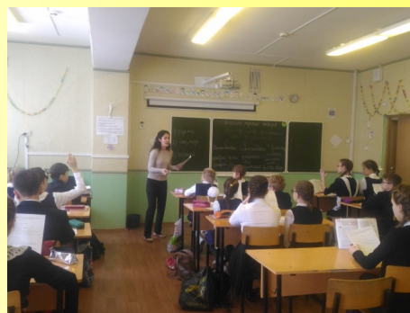
Информатика. Квест-игра. «На просторах Интернета»