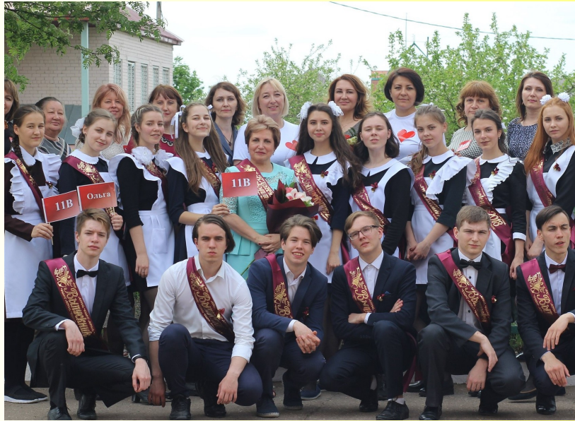
Моему любимому 11в классу