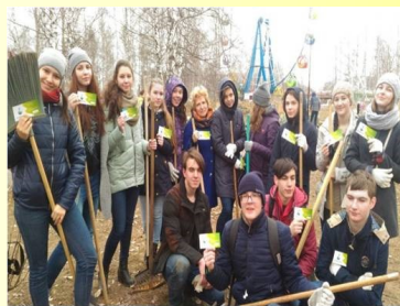
Всероссийские заповедные уроки