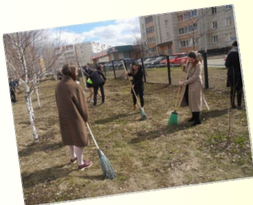
Акция «Поможем братьям нашим меньшим»