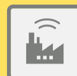
ГУДКИ ПРЕДПРИЯТИЙ И ТРАНСПОРТНЫХ СРЕДСТВ