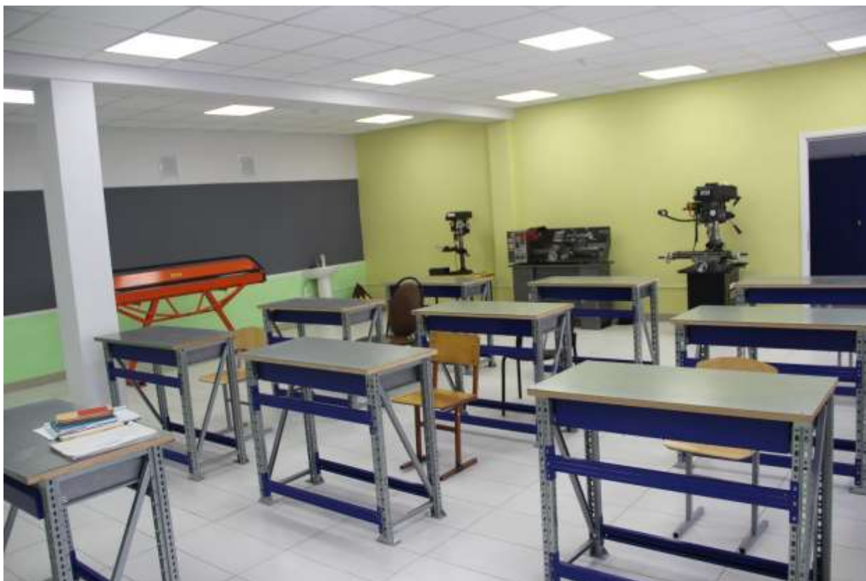
№ 43 Сварочная для сварки металлов