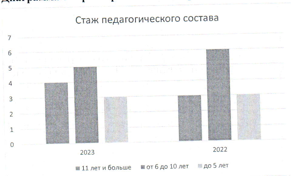
Диаграмма с характеристиками кадрового состава детского сада

Для успешной адаптации педагогов им назначили наставников из числа опытных педагогов.