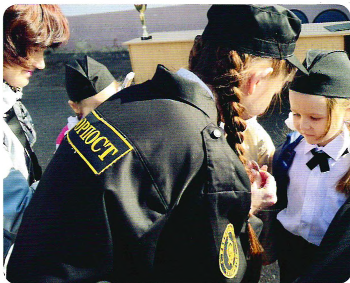
Посвящение дошкольников в отряд «Юные помощники полиции»

ники проводят профилактику нарушений порядка в детском саду и участвуют в городских акциях совместно с отрядом «Форпост». Как педагоги организовали работу отряда – читайте в статье.