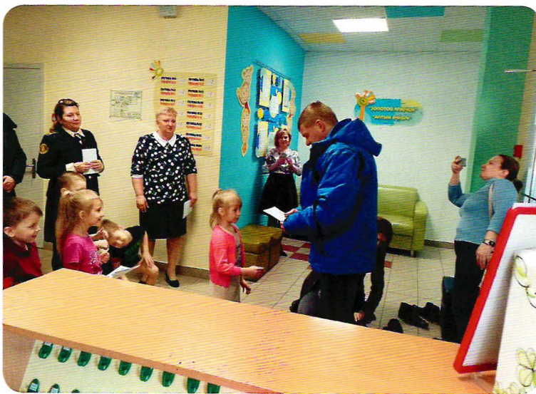
Участие в акции «Осторожно – мошенники»

организуют рейды по соблюдению правил порядка. Проверяют, чтобы в детском саду и в обществен- ных местах их сверстники не дрались, не мусорили, вежливо обращались к друг другу. Участие детей в работе отряда дисциплинирует их, воспитывает требовательность к себе и окружающим, формиру- ет ответственное отношение к правилам поведе- ния. Родители поддерживают своих детей и при- нимают участие в работе отряда.