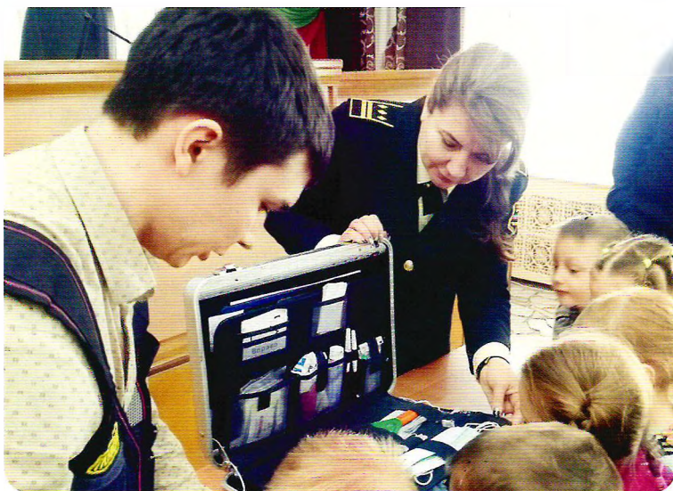
Изучение чемодана эксперта-криминалиста

себя в роли сотрудника полиции и примерить элементы их обмундирования. Особый интерес у детей вызвал чемодан, который продемонстрировал эксперт-криминалист. Он показал детям содержимое чемодана и как криминалисты осуществляют изъятие следов рук.