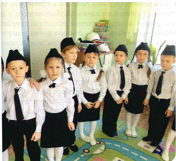
Участники отряда «Юные помощники полиции»