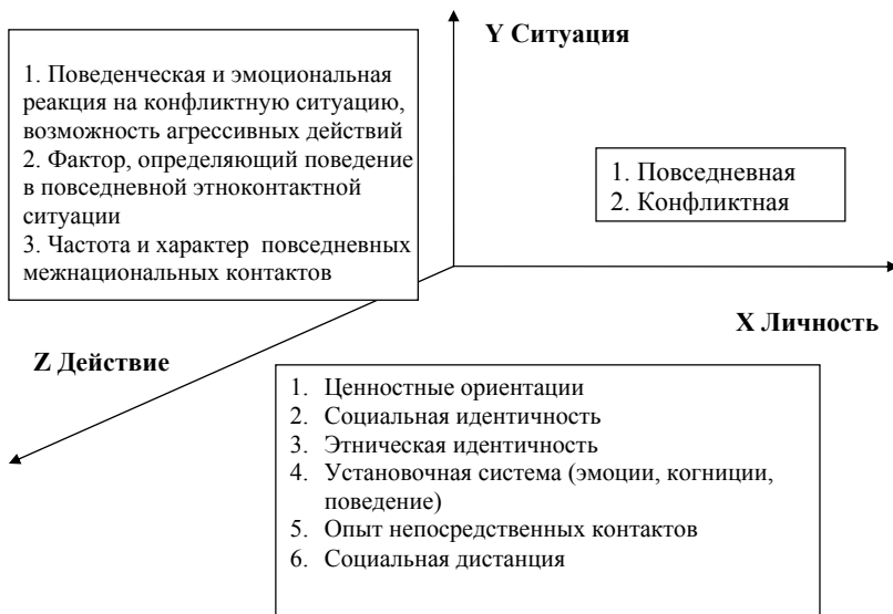
Рис. 2. Признаки свойства толерантности

менными и позволяет найти характеристики (толерантные или интолерантные) системы действия.