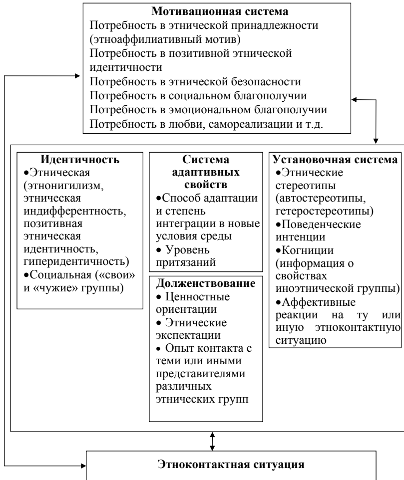
Рис. 1. Структура системы действия в этноконтактной ситуации

Упомянутые свойства систем действия возникают только на определенном уровне сложности отношений единиц действия друг к другу. Эти свойства не могут быть обнаружены в отдельном, единичном действии, рассматриваемом в отрыве от его отношения к другим действиям в той же системе. Они не могут быть выведены в процессе анализа свойств изолированной единицы действия.