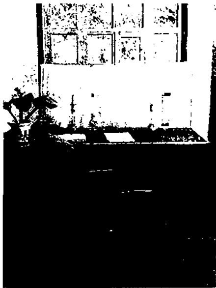
Кабинет М. Ю. Лермонтова в мемориальном музее в Пятигорске. Фотография

«водяное общество» Пятигорска. Попала на страницы повести и «эолова арфа», беседка, внутри которой в деревянном футляре были установлены две арфы, начинавшие звучать при порыве ветра. От беседки открывалась живописная панорама города и окрестностей, поэтому это место было избрано отдыхающими для прогулок между процедурами. По утрам отдыхающие собирались перед существующей до наших дней галереей пить лечебную воду. Лермонтов упоминает реально существовавший магазин Челахова и другие приметы хорошо знакомого ему города. Видимо, тогда же поэт начал работу над живописным полотном «Вид Пятигорска».