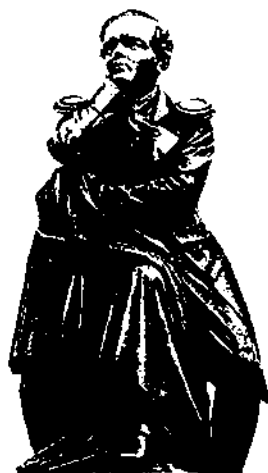
Памятник М. Ю. Лермонтову в Пятигорске. Скульптор А. М. Опекушин

дых офицеров. Здесь и произошла роковая ссора с Мартыновым, которая закончилась дуэлью с трагическим финалом.