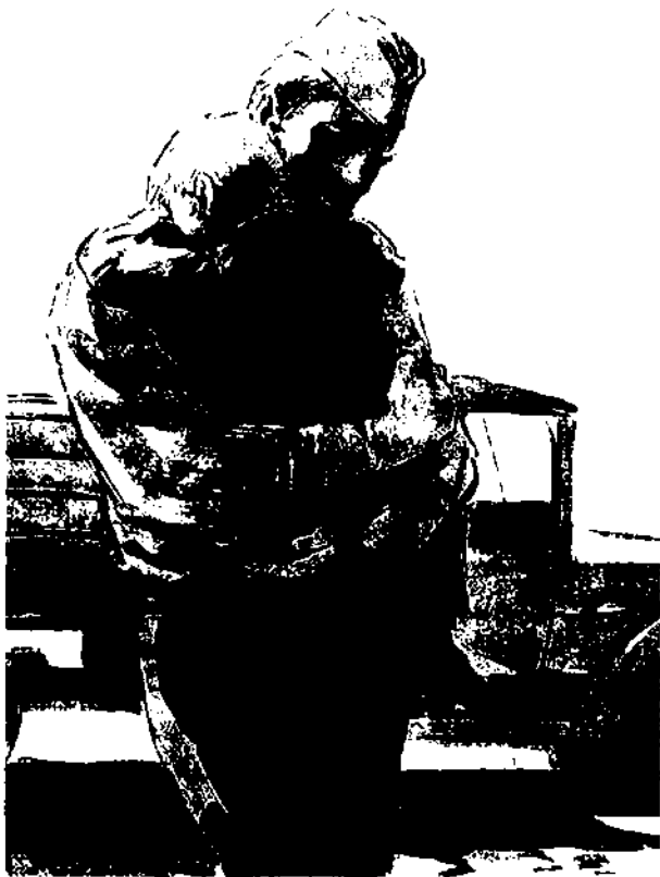
«Судьба человека». Художники Кукрыниксы

и спросил, как выдохнул: «Кто?» Я ему и говорю так же тихо: «Я — твой отец».