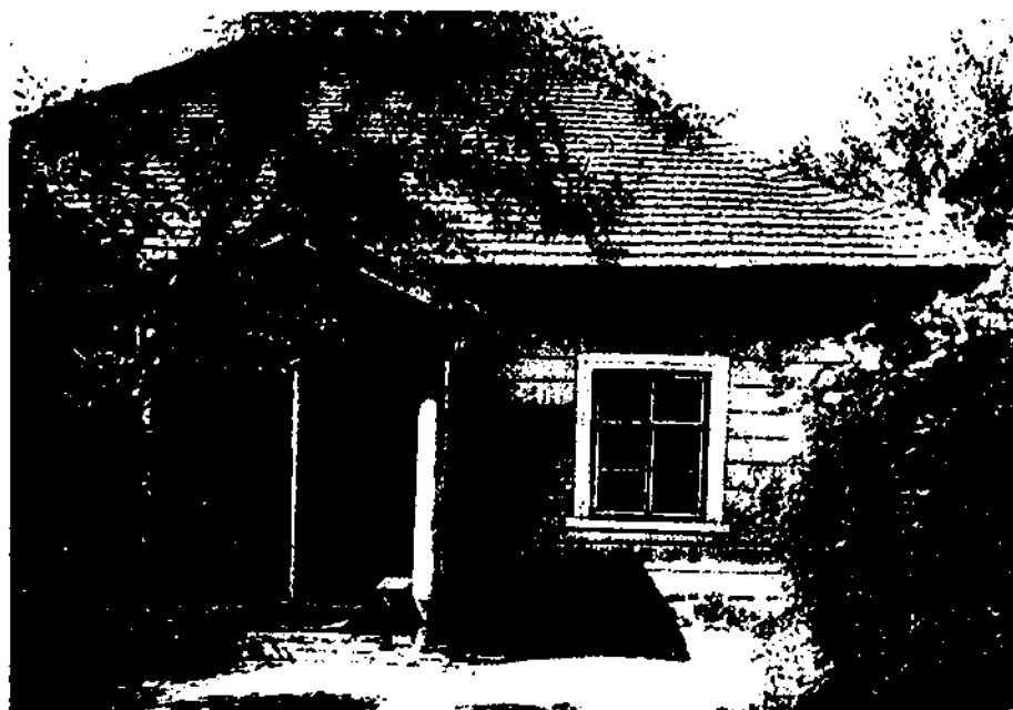
Михайловское. Домик няни. Фотография