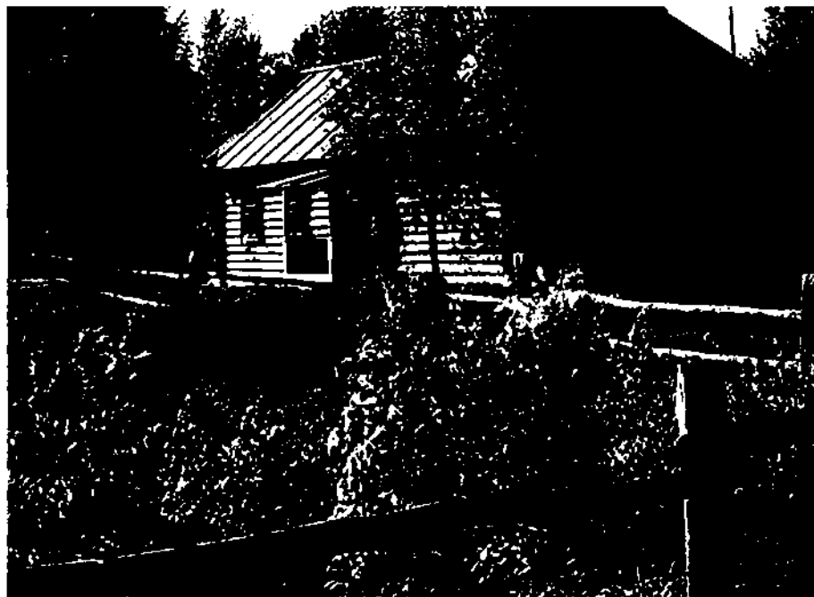
Дом Твардовских в Загорье. Фотография

торый был куплен отцом поэта Трифоном Гордеевичем через Земельный банк с выплатой в рассрочку. Этот клочок земли теперь известен как «поэтическое Загорье» — малая родина поэта, «начало всех начал».