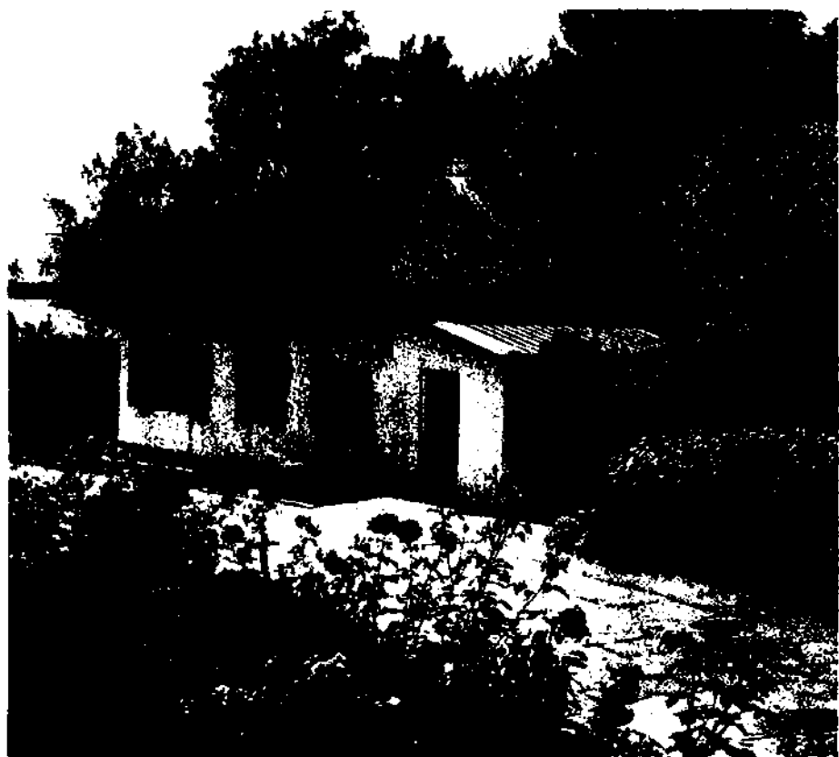
Мемориальный музей «Домик Лермонтова» в Пятигорске. Фотография

Пятигорские впечатления легли в основу повести «Княжна Мери», где описаны многие достопримечательные места города и окрестностей. На страницах повести мы встречаем упоминание о гроте Дианы, на площадке перед которым по вечерам собиралось