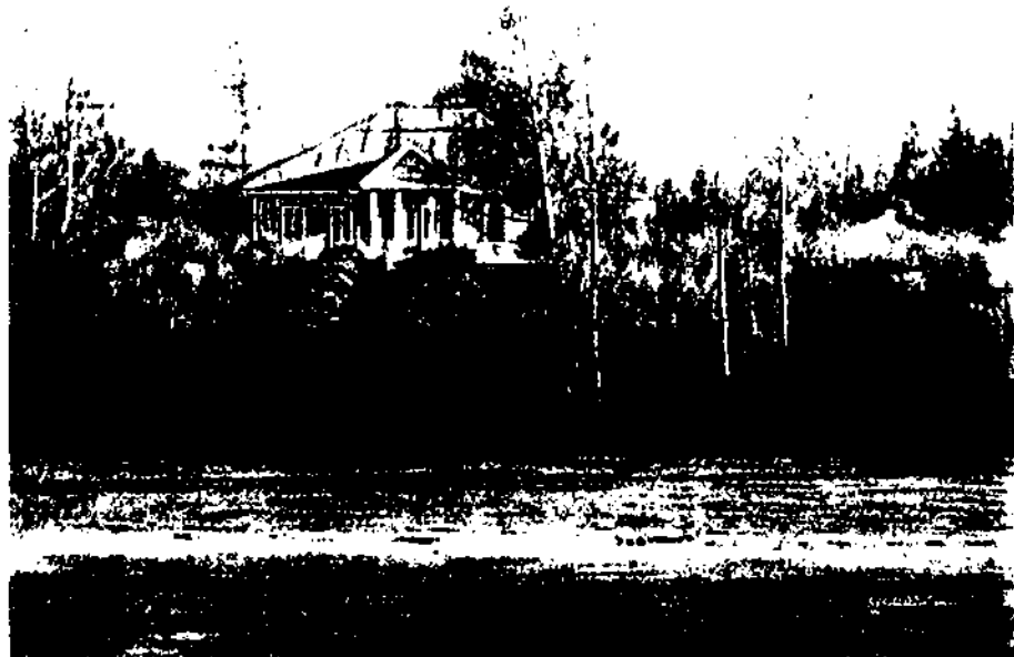
Михайловское. Дом-музей А. С. Пушкина. Фотография