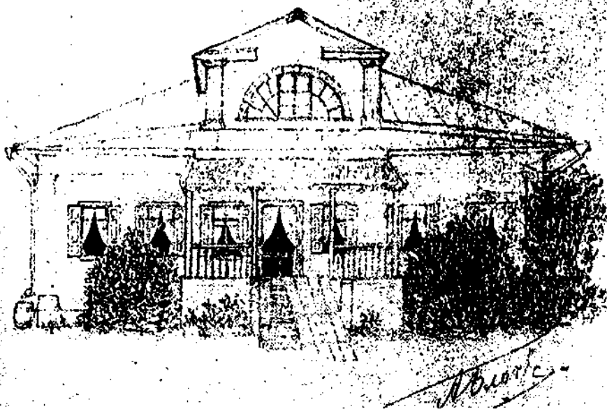
Старый дом в Шахматове (построен около 1812 г.). Рисунок А. Блока. 3 июня 1900 г.

...леса, поляны, И перелески, и шоссе, Наша русская дорога, Наши русские туманы, Наши шелесты в овсе...»