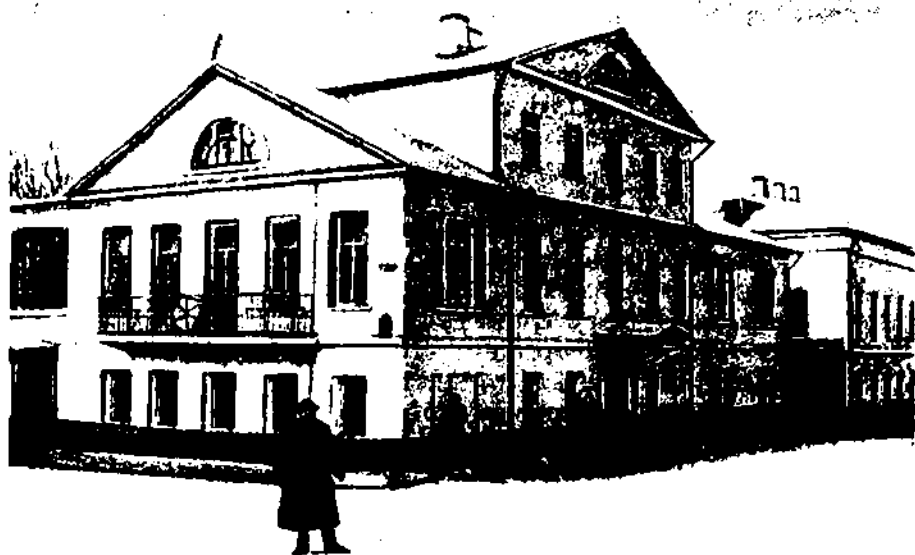
Дом Грибоедовых на Новинском бульваре в Москве. Фотография. Конец XIX в.