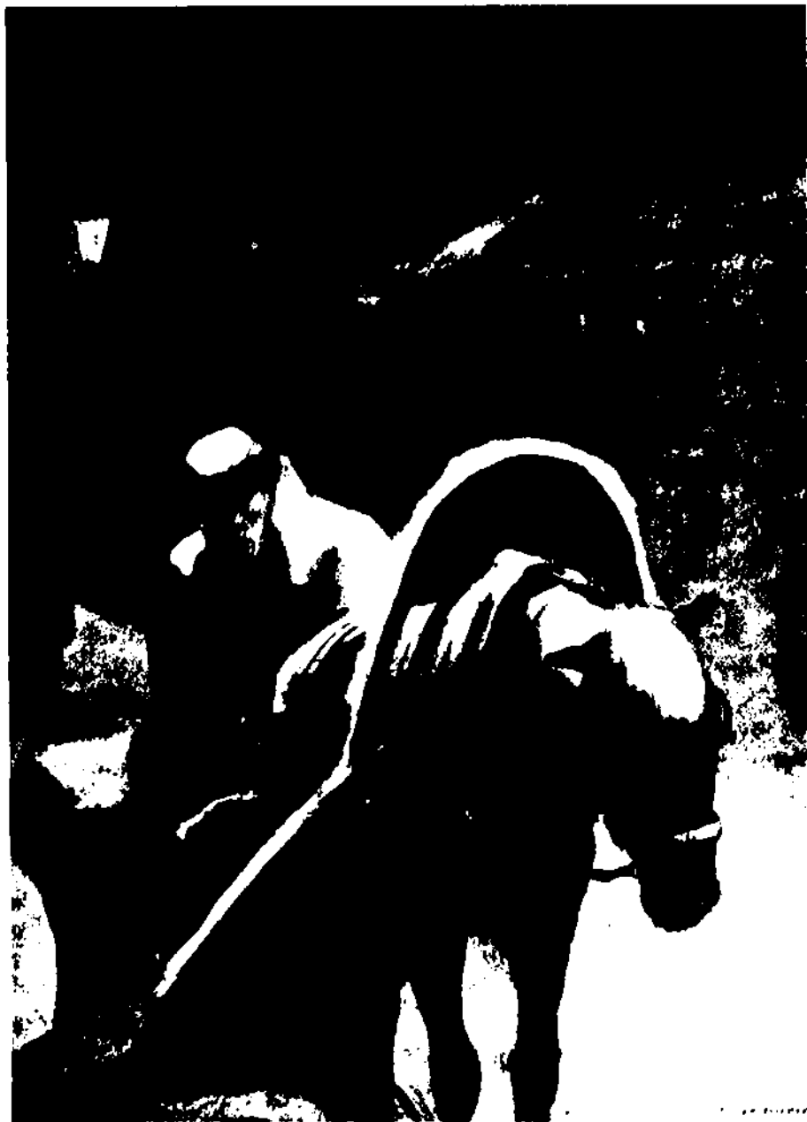
«Тоска». Художники Кукрыниксы