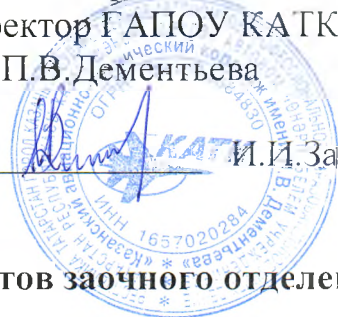
График учебно-экзаменационных сессий студентов заочного отделения на 2017-2018 учебный год