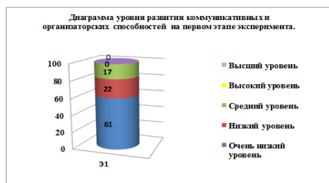
Рис.1 Качественный анализ уровня развития коммуникативных и организаторских способностей на констатирующем этапе

Для определения коммуникативных и организаторских склонностей студентов Камско - Полянского филиала «НМК» использовалась методика КОС-2.