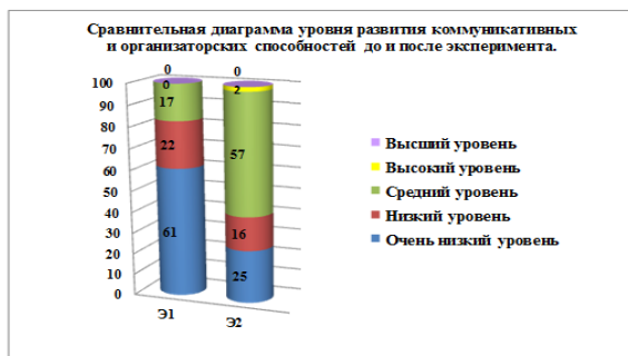
Рис.2 Качественный анализ уровня развития коммуникативных и организаторских способностей до и после эксперимента