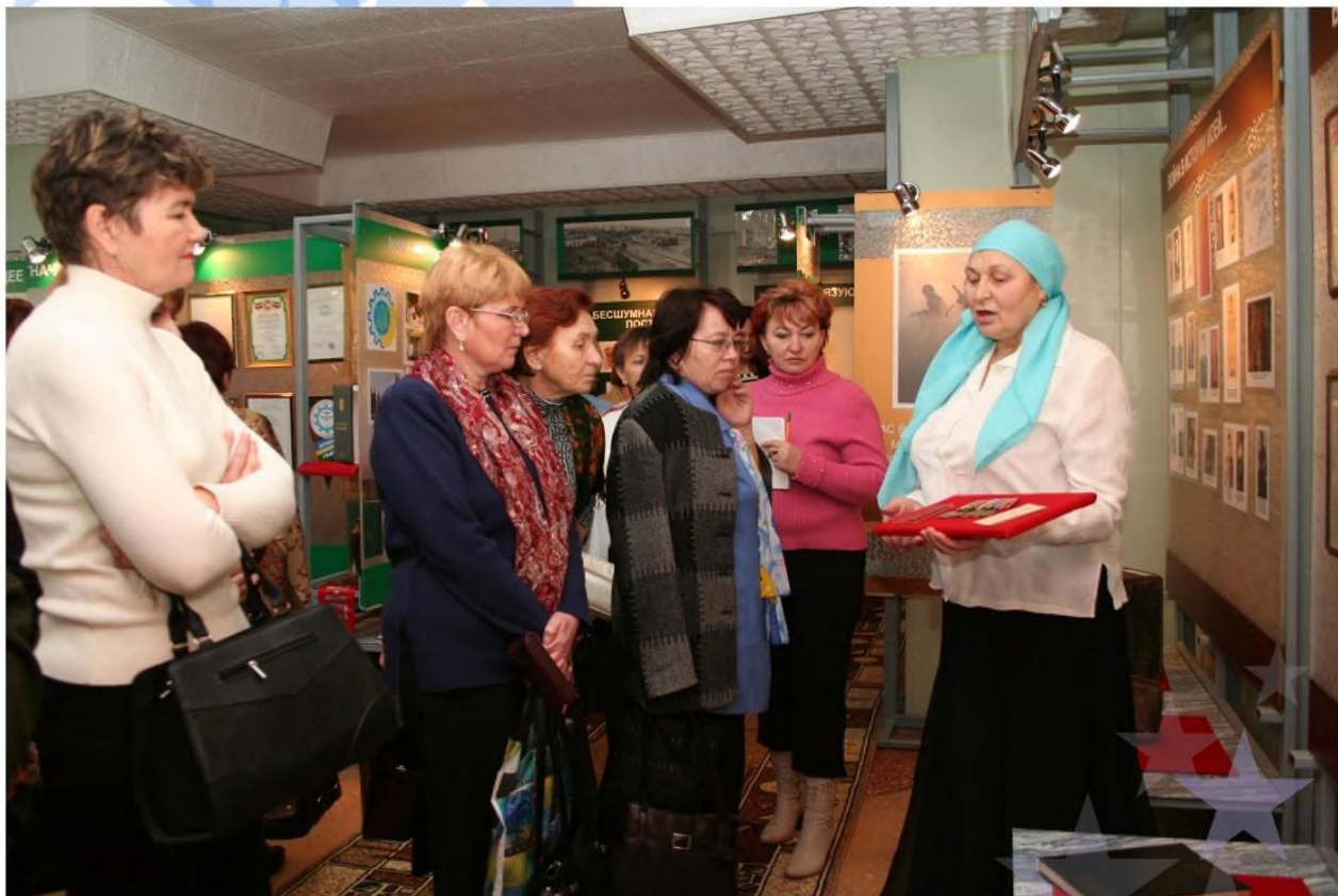
Республиканский семинар работников музея (экскурсия по музею)