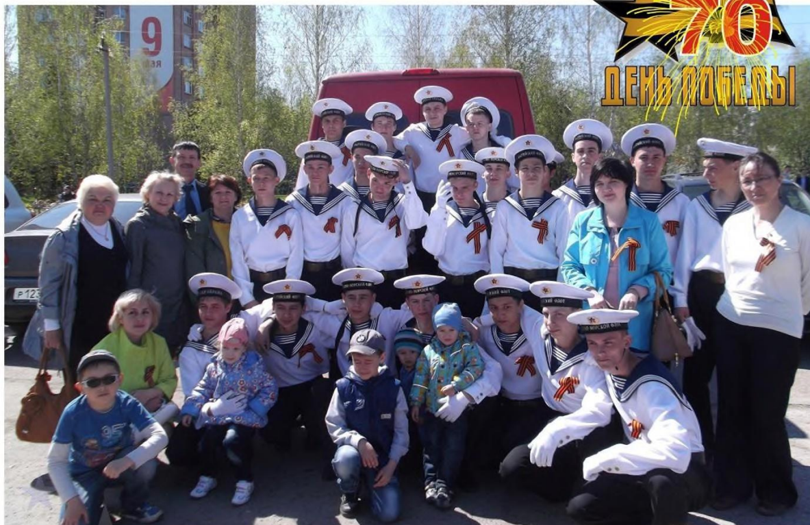
Парад Победы - наш любимый праздник

а в первую очередь показать малоизвестные и уникальные, ранее не опубликованные, материалы, передающие многогранность описываемых событий и сложную судьбу человека. В основе нашего проекта лежит идея осветить известные и неизвестные исторические факты этого периода под разными углами зрения, найти новые фактографические материалы, интересные детали общеизвестных событий.