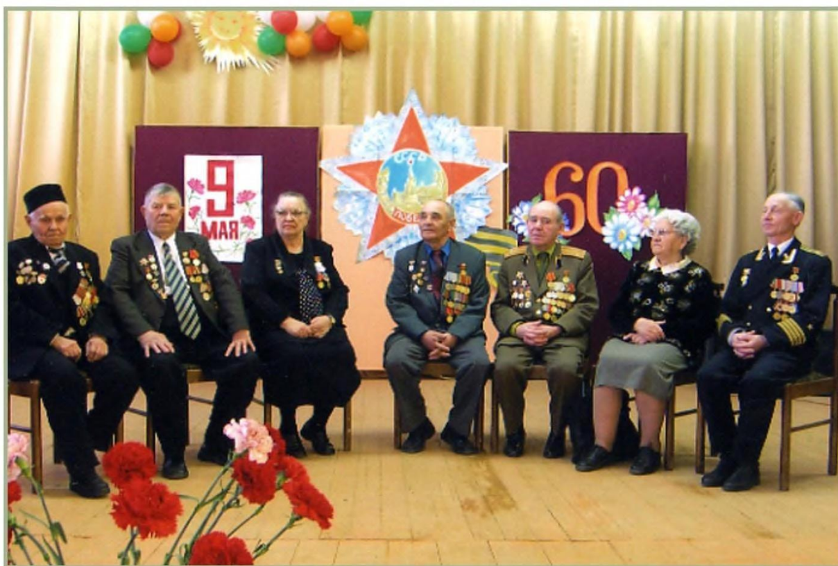
Регулярные встречи с ветеранами ВОВ

ПРОЕКТ «Календарь Победы» создан с целью сохранить память о ключевом событии истории России и мировой истории — Великой Отечественной войне. Этот проект важен для всех последующих поколений, потомков людей, героически сражавшихся за освобождение нашей Родины, как летопись судеб целого народа и знаменательных событий, изменивших ход истории.