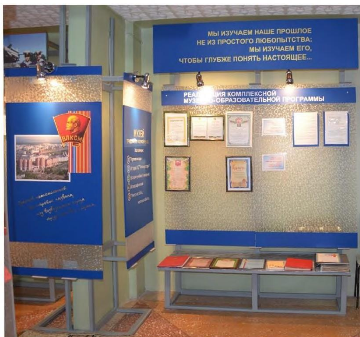
Реализация комплексной музейно-образовательной программы