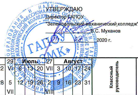
ГРАФИК УЧЕБНОГО ПРОЦЕССА по ПКРС НА 2020-2021 УЧЕБНЫЙ ГОД