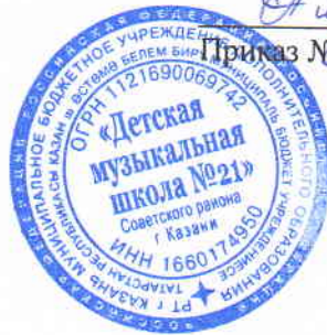
График работы МБУДО «Детская музыкальная школа №21»

ПРИНЯТО: на общем собрании трудового коллектива МБУДО «Детская музыкальная школа №21» Советского района г.Казани протокол № 1 от 26.08.2021г