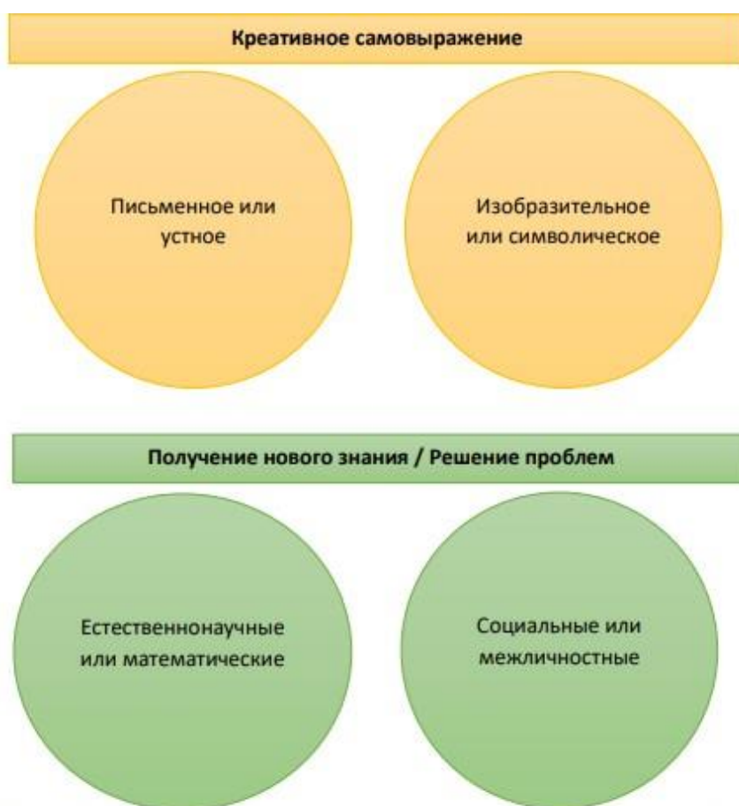
Рисунок 2. Четыре предлагаемых содержательных области оценки

Письменное самовыражение требует от учащихся продемонстрировать воображение и уважение к правилам и условиям, которые делают создаваемые тексты понятными различным аудиториям. В заданиях используются различные модели: (1) создание свободных высказываний и текстов (с указанными ограничениями по объему); (2) выдвижение идей для создания текстов на основе рассмотрения различных стимулов, таких как рисованные мультфильмы без заголовков, фантастические иллюстрации или ряд абстрактных картинок; (3) оценка креативности приводимых высказываний, например, заголовков, историй, лозунгов и т.п.; (4) совершенствование собственных или чужих текстов. Визуальное самовыражение предполагает, что учащиеся исследуют, экспериментируют и выражают различные идеи с помощью разнообразных изобразительно-выразительных средств. В