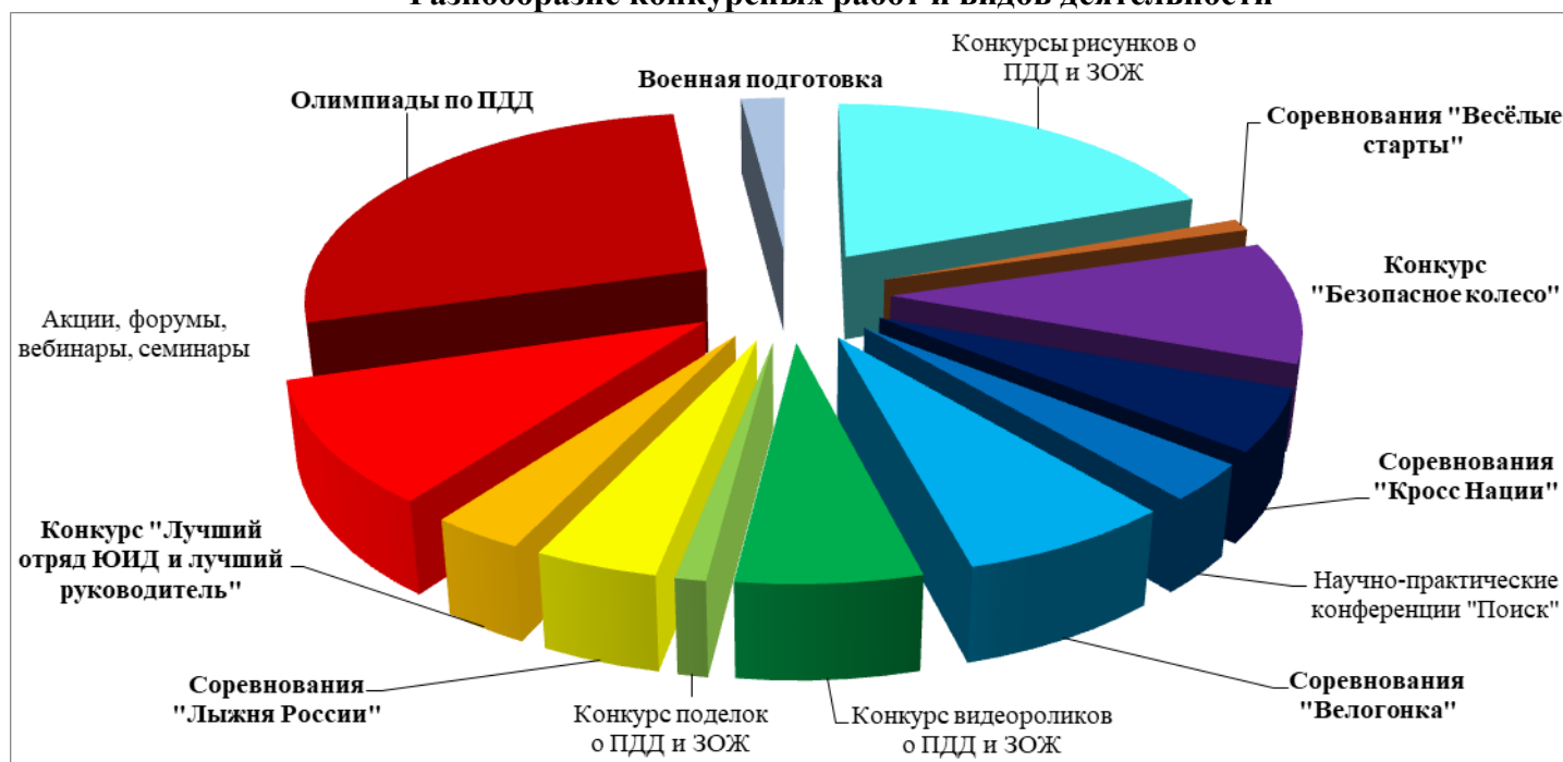
Таблица с перечнем достижений учащихся объединения