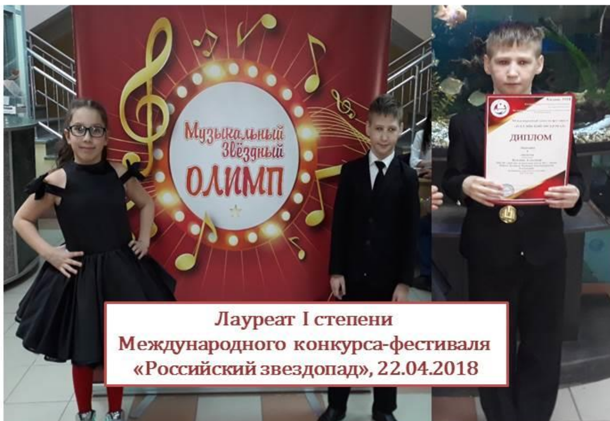
Лауреат I степени Международного конкурса-фестиваля «Российский звездопад», 22.04.2018