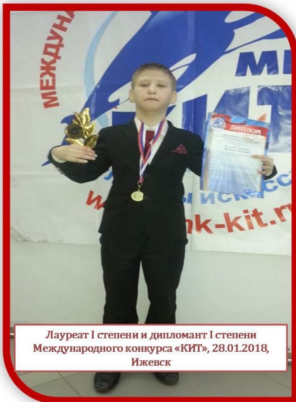
Лауреат I степени и дипломант I степени Международного конкурса «КИТ», 28.01.2018, Ижевск