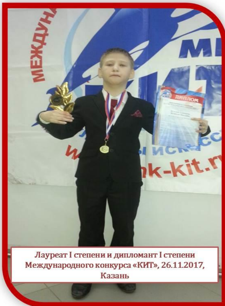
Лауреат I степени и дипломант I степени Международного конкурса «КИТ», 26.11.2017, Казань