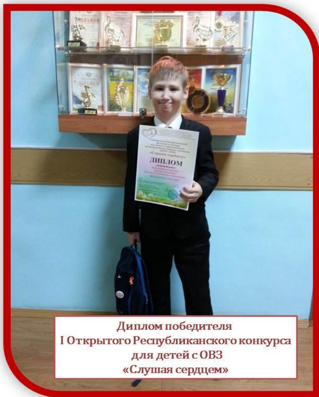
Диплом победителя I Открытого Республиканского конкурса для детей с ОВЗ «Слушая сердцем»

5. Республиканский открытый фестиваль-конкурс для детей с ограниченными возможностями «Слушая сердцем» (07.12.2017 г.). Диплом фестиваля-конкурса.