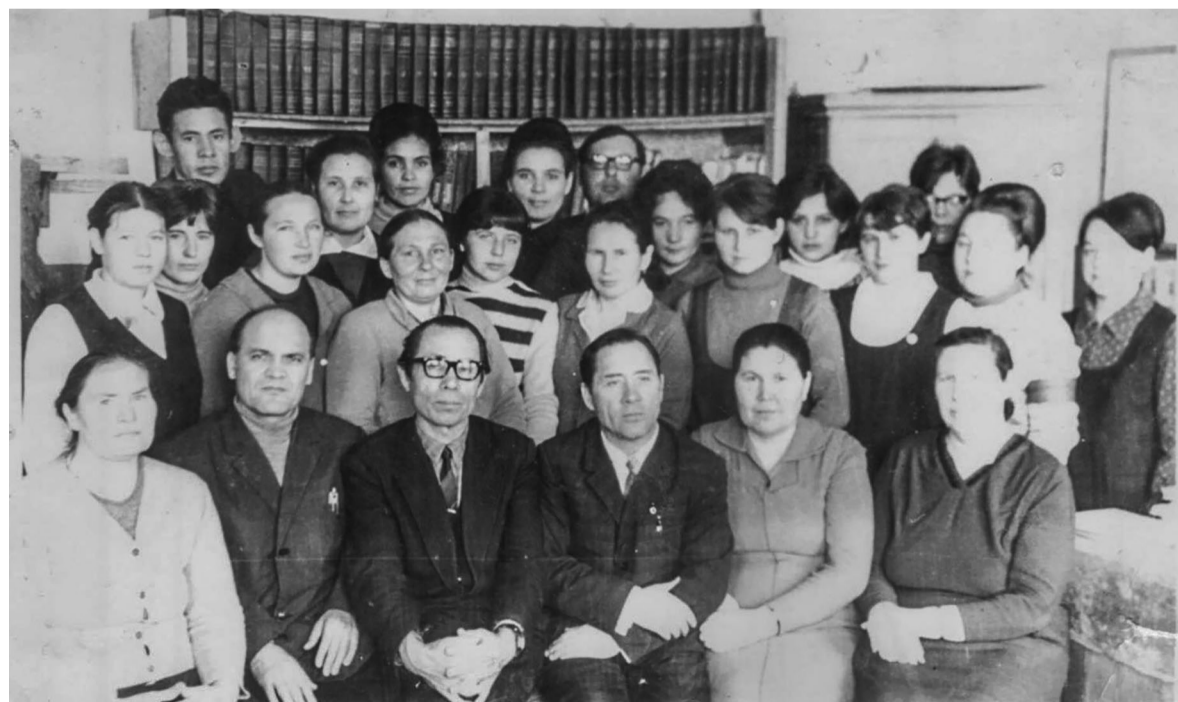
☒ Мәлләтамак урта мәктәбе коллективы. 1970 нче еллар.