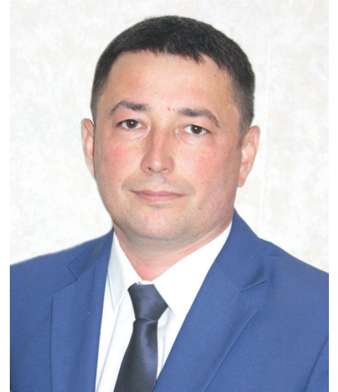
☉ Фото – “Мөслим-информ” архивынан.

– Милли мәгариф үсешен тәмин итү – мәгариф идарәсенәң төп эшчәнлек юнәлешләреннән берсе. Районда 98,71 процент укучы туган тел дип – татар телен, 1,28 процент мари телен сайлады. 13 гомуми белем