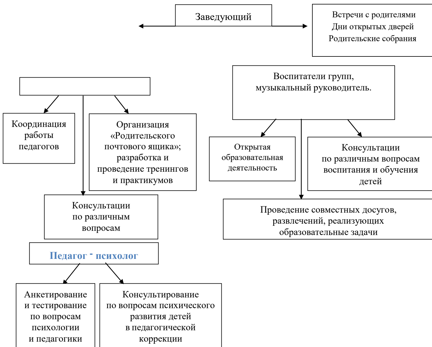
Рис. 1 «Схема взаимодействия с семьями воспитанников»