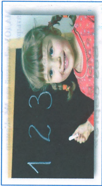
Дети с ОВЗ - это дети с

ограниченными возможностями здоровья. Дети , состояние здоровья которых препятствует освоению образовательных программ вне специальных условий обучения и воспитания, то есть это дети-инвалиды либо другие дети в возрасте до 18 лет, не признанные в установленном порядке детьми-инвалидами, но имеющие временные или постоянные отклонения в физическом и (или) психическом развитии и нуждающиеся в создании специальных условий обучения и воспитания. детей с ОВЗ. Приветственное слово участникам семинара.