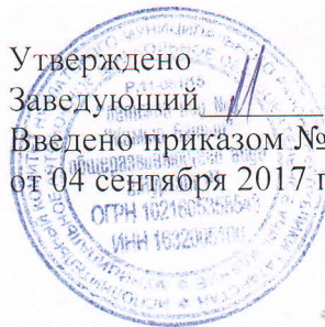
График закладки основных продуктов питания, выписанных в меню-требовании, в котел на пищеблоке в МАДОУ «Детский сад № 5 «Камыр Батыр» общеразвивающего вида» г.Нурлат РТ

Утверждено Заведующий В.Ш.Марданшина Введено приказом № 128 от 04 сентября 2017 г.