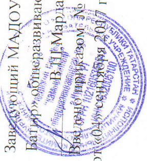
График выдачи пищи на 2017-2018 учебный год