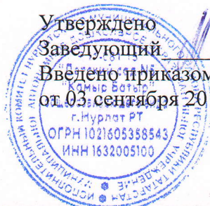
График закладки основных продуктов питания, выписанных в меню-требовании, в котел на пищеблоке в МАДОУ «Детский сад № 5 «Камыр Батыр» общеразвивающего вида» г.Нурлат РТ

Утверждено Заведующий В.Ш.Марданшина Введено приказом № 103 от 03 сентября 2018 г.