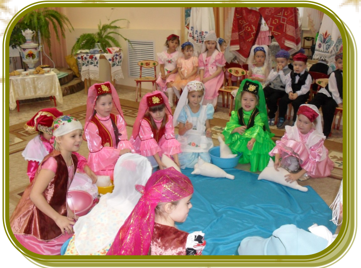
Я ГОВОРЮ ПО - ТАТАРСКИ