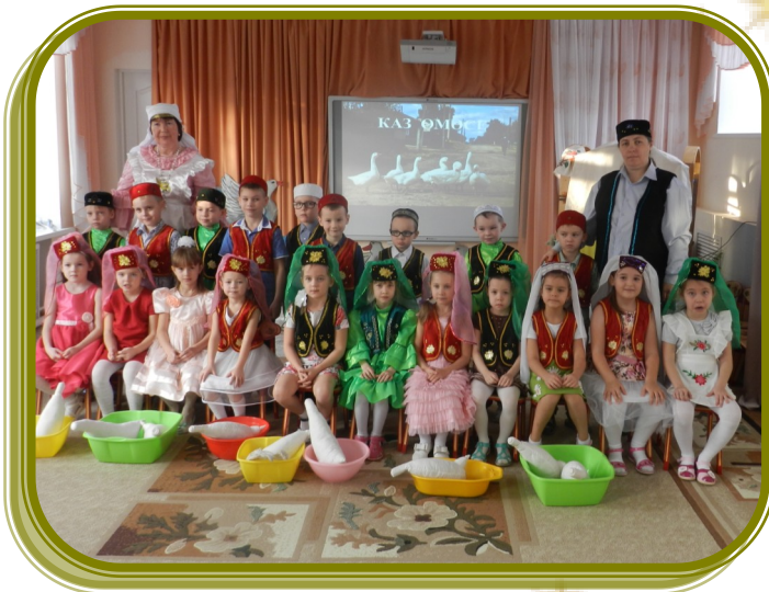
МИН ТАТАРЧА СӨЙЛӘШӘМ

Авторы: Осипова Э.Ш МБМБУ “Әкият” балалар бакчасы татар теле тәрбиячесе