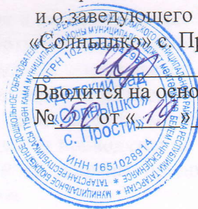
График рабочего времени МБДОУ «Детский сад «Солнышко» с. Прости» НМР РТ