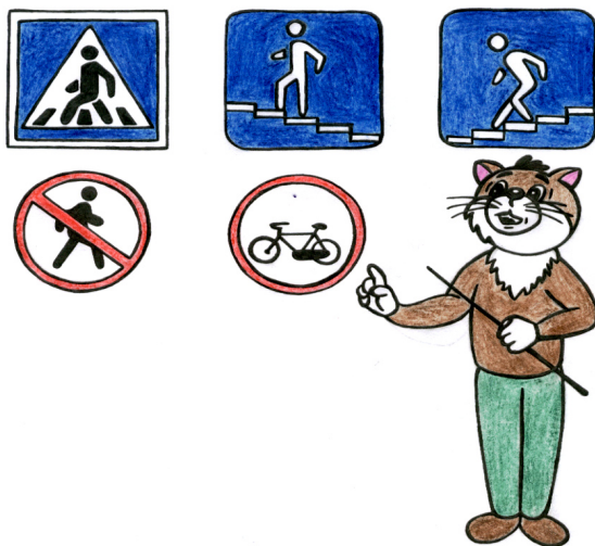
Рис. 3. Дорожные знаки: пешеходный переход, надземный пешеходный переход, подземный пешеходный переход, движение пешеходов запрещено, движение на велосипедах запрещено

6) посвятить отдельную прогулку правилам перехода через дорогу. Проверьте, правильно ли ваш ребенок их понимает, умеет ли использовать эти знания в реальных дорожных ситуациях. Для этого потренируйтесь вместе переходить по пешеходному переходу через дорогу с односторонним и двусторонним движением, через регулируемый и нерегулируемый пешеходный переход;