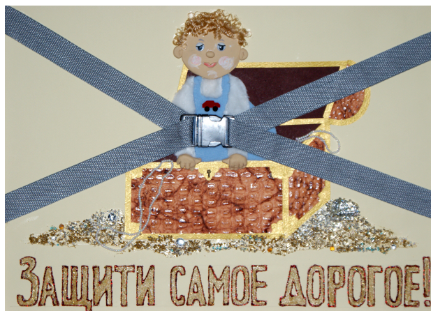
Фото 3. Конкурсный плакат