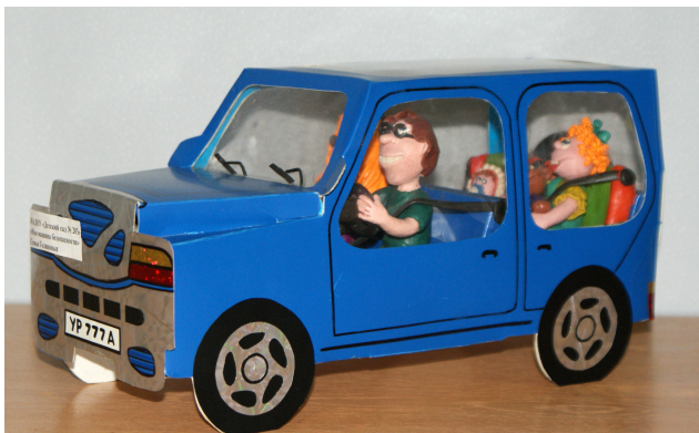
Фото 2. Конкурсная поделка

Программа конкурса включает номинации: поделки (фото 2), рисунки, фото, плакаты (фото 3).