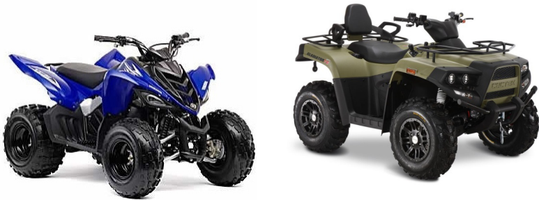
Рис. 4. Квадроциклы

Квадроцикл – мототранспортное средство с четырьмя колесам без кузова повышенной проходимости (рис. 4). Многие из них подпадают под категорию мотовездеходов (небольшое транспортное средство, похожее на мотоцикл, но имеющее более 2 колес). Они не допущены к эксплуатации на дорогах общего пользования и не подлежат сертификации и регистрации в органах ГИБДД, их регистрация осуществляется в органах Ростехнадзора на основании паспорта самоходной машины (ПСМ).