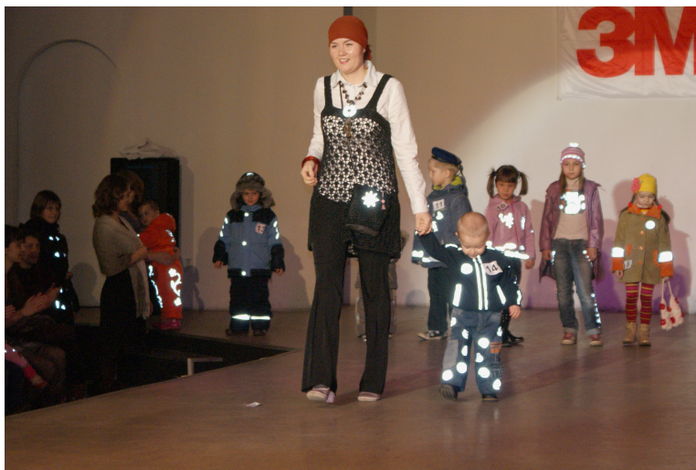
Фото 1. Дефиле в одежде со световозвращающими элементами

С каждым годом увеличивается число принявших участие в конкурсе. В прошлом, 2013 году, их было 118. В период проведения праздника проводится дефиле, в котором дети демонстрируют созданные мамами безопасные костюмы. Каждая участница получает приз. И все же главным подарком для каждой из участниц является безопасность собственного ребенка.