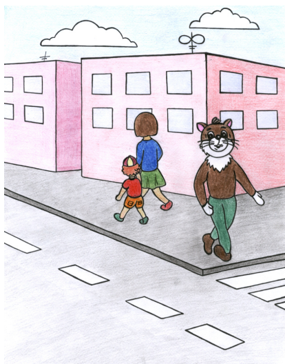
Рис. 1. Переходить дорогу нужно по пешеходному переходу, убедившись, что все автомобили остановились и переход через дорогу безопасен!

2. Нельзя ходить вдоль проезжей части при наличии тротуаров или обочины.