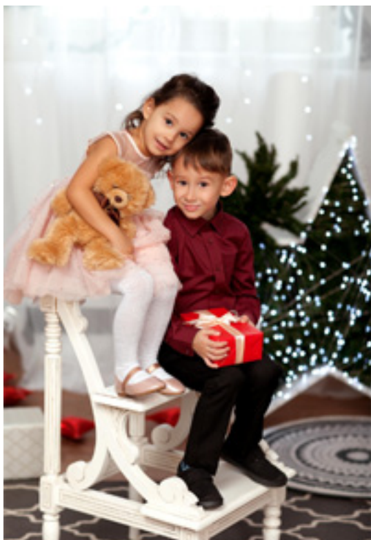
Фото работа «Новогодние чудеса»

КРОО ПСП «Дошкольник» г. Красноярск, ул. Академгородок 30-21, e-mail: doshkolnik@list.ru