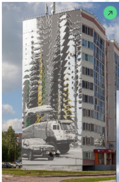
Мурал №1 «Начало»