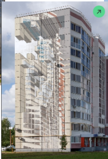
Мурал №2 «Точка сборки»