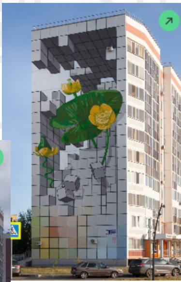
Мурал №3 «Всходы»