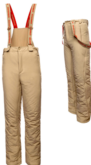
Брюки утеплённые (тактические) бежевого цвета