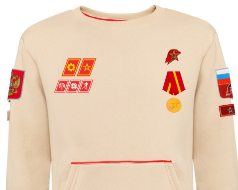
Размещение знаков различия, знаков отличия и иных геральдических знаков на толстовке бежевого цвета