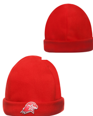
Шапка флисовая вязаная красного цвета