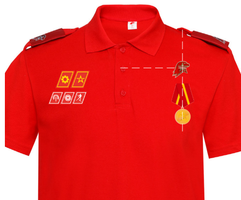
Размещение знаков различия, знаков отличия и иных геральдических знаков на рубашке поло красного (синего) цвета