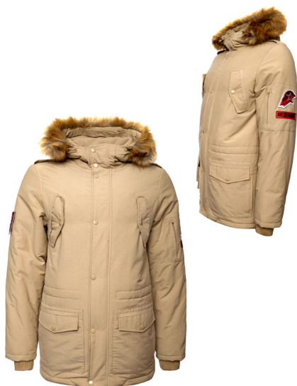
Куртка зимняя утеплённая бежевая с капюшоном и отделкой к капюшону из искусственного меха коричневого цвета