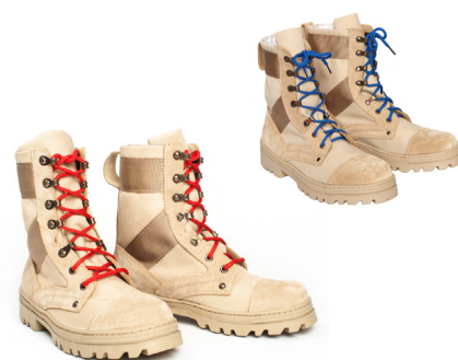
Ботинки с высокими берцами утеплённые бежевого цвета со шнурками красного (синего, бежевого) цвета