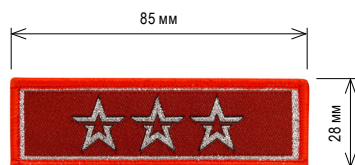
Нарукавный знак, определяющий принадлежность к ВВПОД «ЮНАРМИЯ»