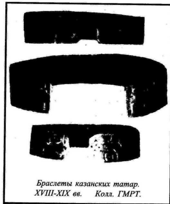
Браслеты казанских татар. XVIII-XIX вв.

Естественно, такое языческое почитание образа барса не могло не войти в противоречие с воззрениями ислама. Несмотря на это, в форме художественных традиций на браслетах образ барса дошел до начала XX века. В некоторых семьях такие браслеты хранятся как реликвия и в настоящее время.