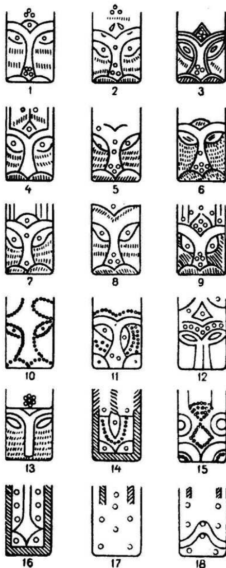
Хронологическое изменение изображения головы барса на браслетах (по Н.Ф.Калинину)

Результаты исследований Н.Ф.Калинина имеют огромное значение в плане подтверждения непрерывной эволюции образа барса, как тотемистического и геральдического символа. На браслетах не менее 6 веков (XIII-XIX вв.) присутствовал и изменялся образ барса, теряя свои реалистические очертания. Это говорит о том, что и в период Золотой Орды, и в годы Казанского ханства, и будучи в составе