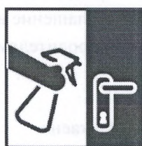
Влажная уборка дома ежедневно