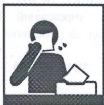
Пользуйтесь одноразовой бумажной салфеткой при чихании, кашле, насморке

Соблюдение следующих гигиенических правил позволит существенно снизить риск заражения или дальнейшего распространения гриппа, коронавирусной инфекции и других