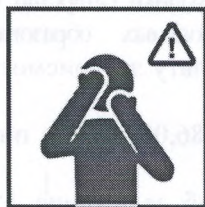
Не прикасайтесь к лицу немальыми руками