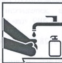
Чаше мойте руки