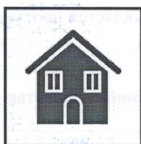
Оставайтесь дома в период массовых заболеваний