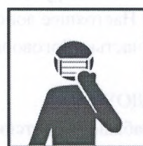
Пользуйтесь одноразовой маской