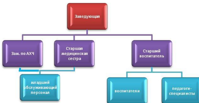
Схема 2. Административное управление ДООУ.