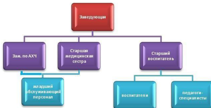
Схема 2. Административное управление детского сада.