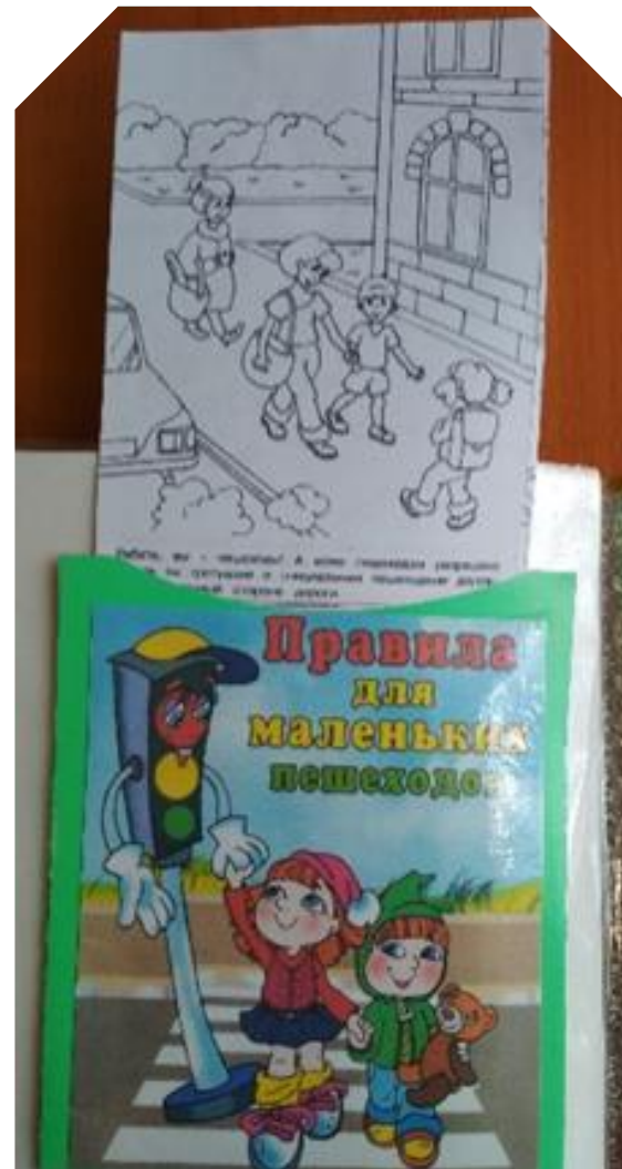
15. Раскраска «Правила для маленьких пешеходов» (для детей от 3-7 лет). Включает в себя сменяемые листы с рисунками для раскрашивания по теме. Цель: закрепить правила дорожного движения для пешеходов