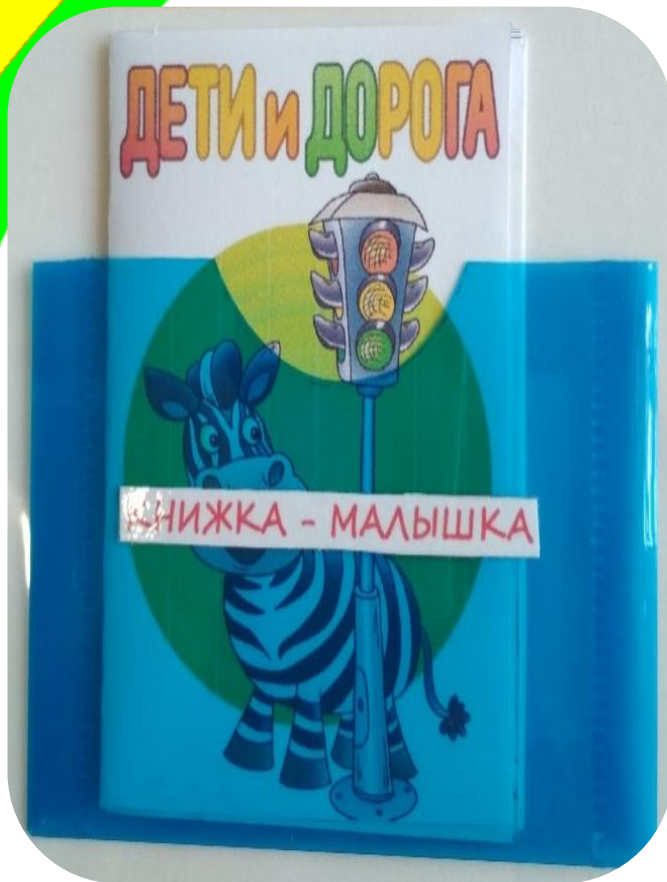
14. Книжка-малышка «Дети и дорога» (для детей от 3 -7 лет). (Книжки постоянно меняются) Цель: развитие интереса к художественной литературе как к источнику познавательной информации о ПДД