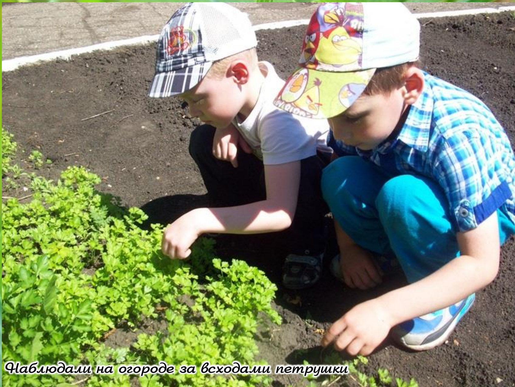
Наблюдали на огороде за всходами петрушки