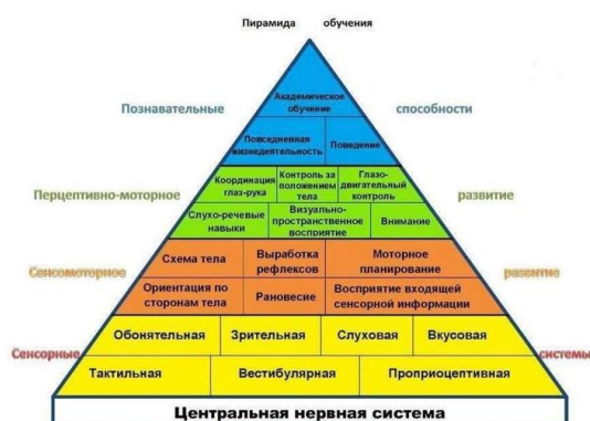
Рис. 2. Пирамида обучения

Пирамида Вильямса и Шеленбергера наглядно иллюстрирует, насколько все обучение ребенка, его интеллект, поведение, речь зависит от нижних этажей и, особенно от фундамента — нервной системы (Рис. 2 Пирамида обучения).