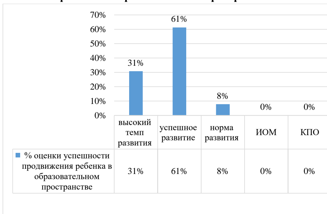
Диаграмма сводных данных результатов оценки успешности продвижения ребенка в образовательном пространстве

Анализ результатов оценка адекватности форм и методов образовательной работы на конец учебного года приведённый в сводной таблице, свидетельствуют о том, что у дошкольников образовательного учреждения показатели итогового получившихся значения по образовательным областям находятся на средне- высоком уровне.