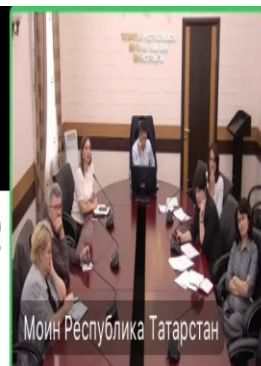
Моин Республика Татарстан