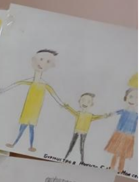
ЕВМУЛТОВА АУДИНА. 1. А. К. А. . МОЯ СЕМЬЯ