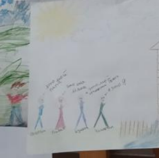
1. А. К. А. . МОЯ СЕМЬЯ