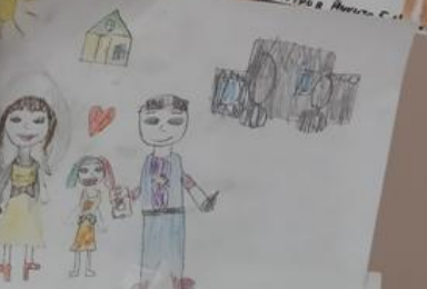
АСТАХОНОВА НАСА. 1. А. К. А. . МОЯ СЕМЬЯ