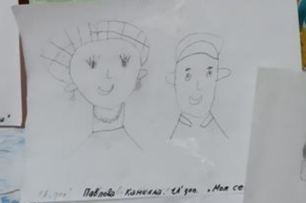
1. А. К. А. . ПАРОВЫХ КАМЕР. 1. А. К. А. . МОЯ СЕМЬЯ