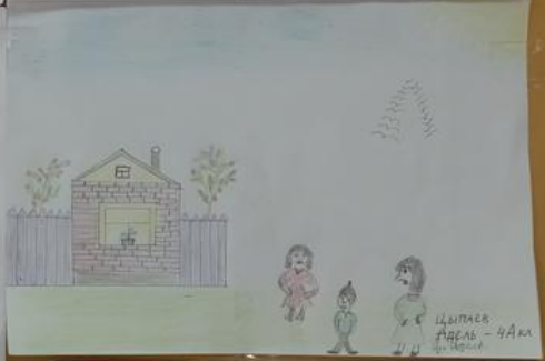
Цыпаев Аидель - 4А кл