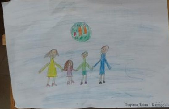
Тюркина Злата 1 Б класс 405