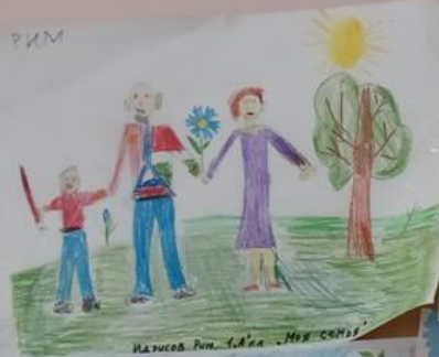
ИЗУСОВ РИМ. 1. А. К. А. . МОЯ СЕМЬЯ