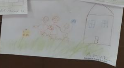
1. А. К. А. . МОЯ СЕМЬЯ