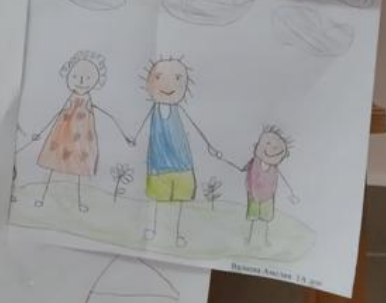
1. А. К. А. . МОЯ СЕМЬЯ