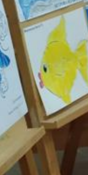
А.С. Пушкин «Сказка о рыбаке и рыбке»