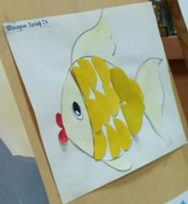
Школьник Ларин 24