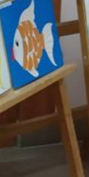
А.С. Пушкин «Сказка о рыбаке и рыбке»