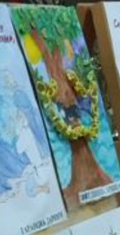
А.С. Пушкин «Сказка о рыбаке и рыбке»