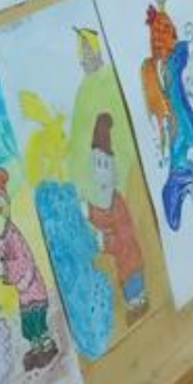
А.С. Пушкин «Сказка о рыбаке и рыбке»