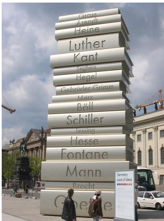
Памятник книгам в Берлине

Всемирный день книг и авторского права (на других официальных языках ООН: англ. World Book and Copyright Day , араб. اليوم العالمي للكتاب وحقوق المؤلف , исп. Día Mundial del Libro y del Derecho de Autor , кит. 世界图书与版权日 , фр. Journée mondiale du livre et du droit d'auteur ) — отмечается ежегодно 23 апреля, начиная с 1996 года. Всемирный день был провозглашён на 28-й сессии ЮНЕСКО 15 ноября 1995 года (резолюция № 3.18).