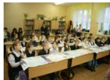
Использование инновационных технологий в учебно-воспитательном пространстве школы

мониторинговые технологии технологии социальных практик информационные технологии лично - развивающие технологии музейно-образовательные технологии здоровьесберегающие технологии