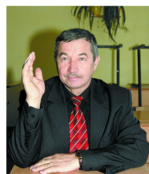
4 нче бит