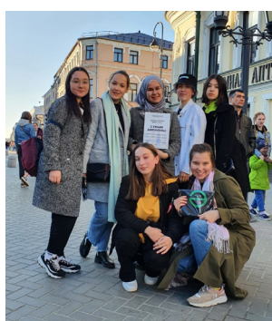
2 нче бит