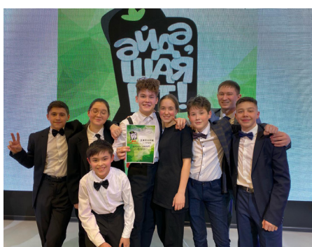
7 нче бит