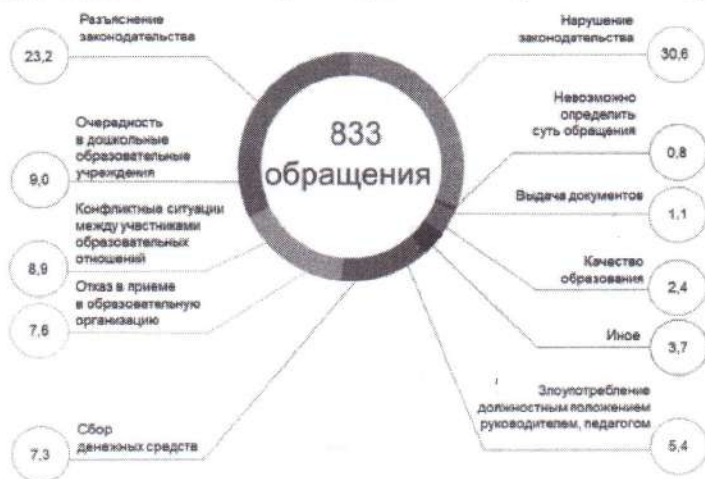
Структура обращений граждан, поступивших в Департамент надзора и контроля в сфере образования Министерства образования и науки РТ в 2019 году, %

Обращения коррупционной направленности поступили из следующих районов (112 обращений):