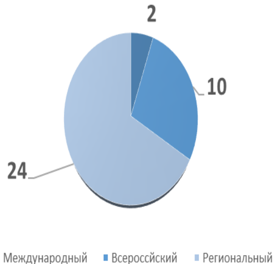
УЧАСТИЕ В ВОСПИТАТЕЛЬНЫХ МЕРОПРИЯТИЯХ РАЗЛИЧНОГО УРОВНЯ

Призеры и победители конкурсов и НПК различного уровня – 31 человек